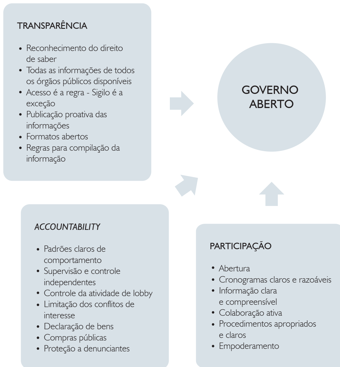
Figura 1 - Condições para Governo Aberto