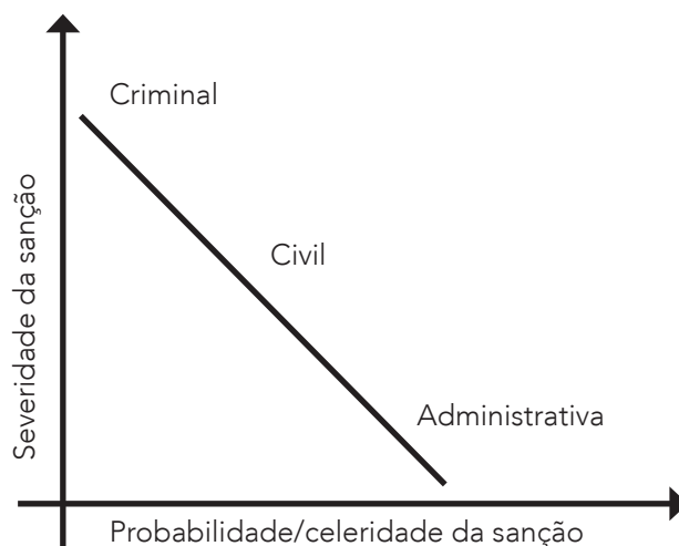
FIGURA 2. POTENCIAL SANCIONATÓRIO DOS TIPOS DE ACCOUNTABILITY LEGAL

E isso se relaciona aos tipos de accountability legal descritos, como a Figura 2, abaixo, representada de forma simples e exploratória.